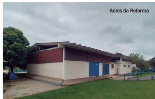
Antes da Reforma