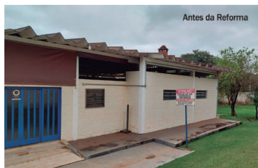
Antes da Reforma