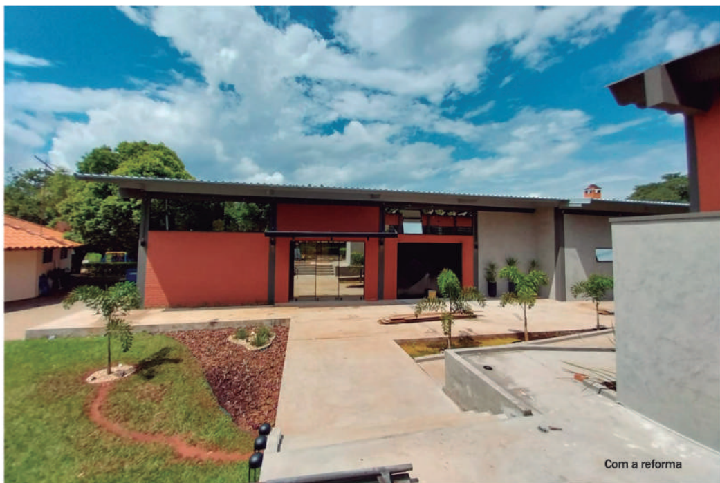
Com a reforma