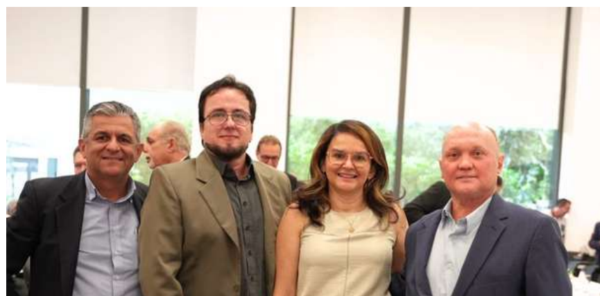
Diretores de Rio Preto participaram da assinatura do ACT da Caixa em SP.

Os Funcionários da Caixa também tiveram grandes conquistas. O Saúde Caixa foi novamente debatido com o compromisso de revisar o teto de custeio do banco e garantir aos empregados admitidos após 2018 o direito de manter o plano após a aposentadoria. A licença-paternidade ganhou flexibilidade, podendo ser iniciada até 120 dias após o nascimento ou alta da criança. Pais de dependentes PcD também conquistaram jornadas mais flexíveis, priorização no trabalho remoto e